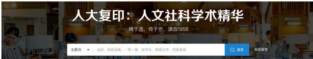
(首页一框式检索、高级检索入口)

平台为用户提供多种检索模式，用户可通过不同检索模式，根据自己的需求精准地查找到文献资源。检索模式包括：一框式检索、高级检索、导航式检索。